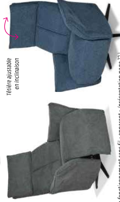
Tête ajustable en inclinaison

Osez son magnifique revêtement bleu océan !!!